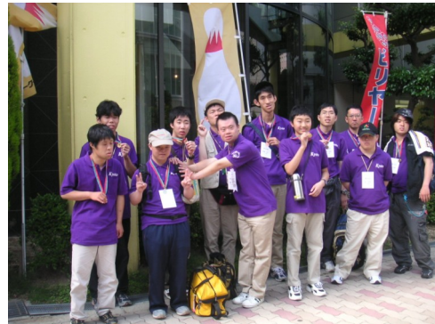
参加アスリートの集合写真