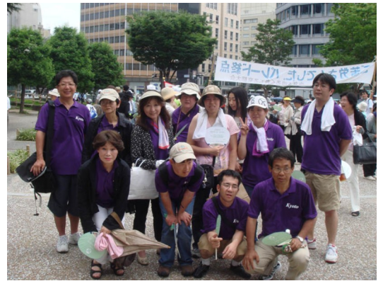
暑い中ご苦労様でした