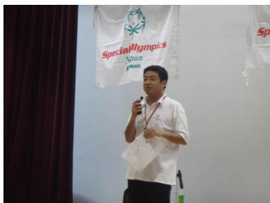
城さん、ご苦労様でした